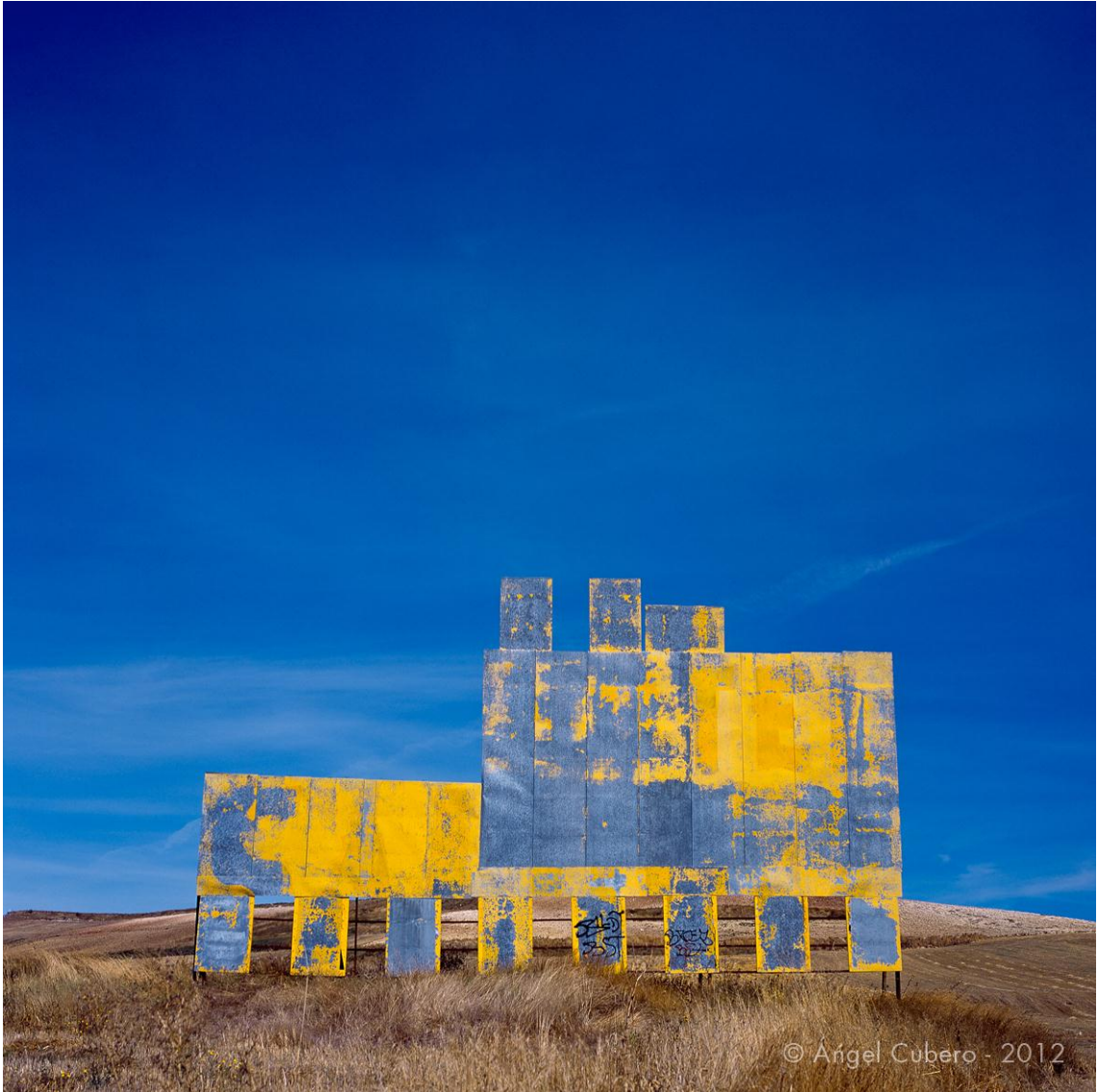
Burgos. Año 2003