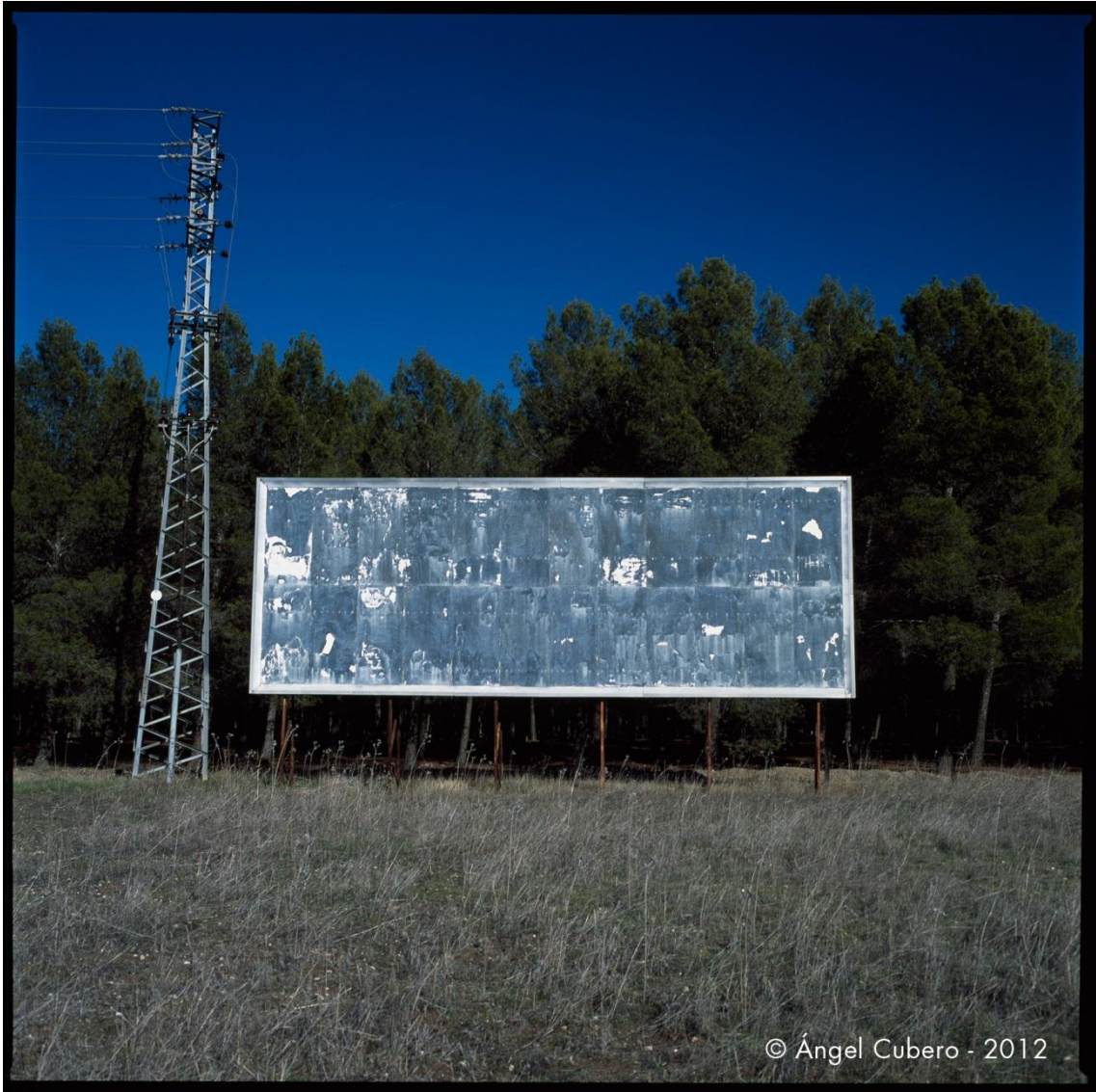
Toledo. Año 2005