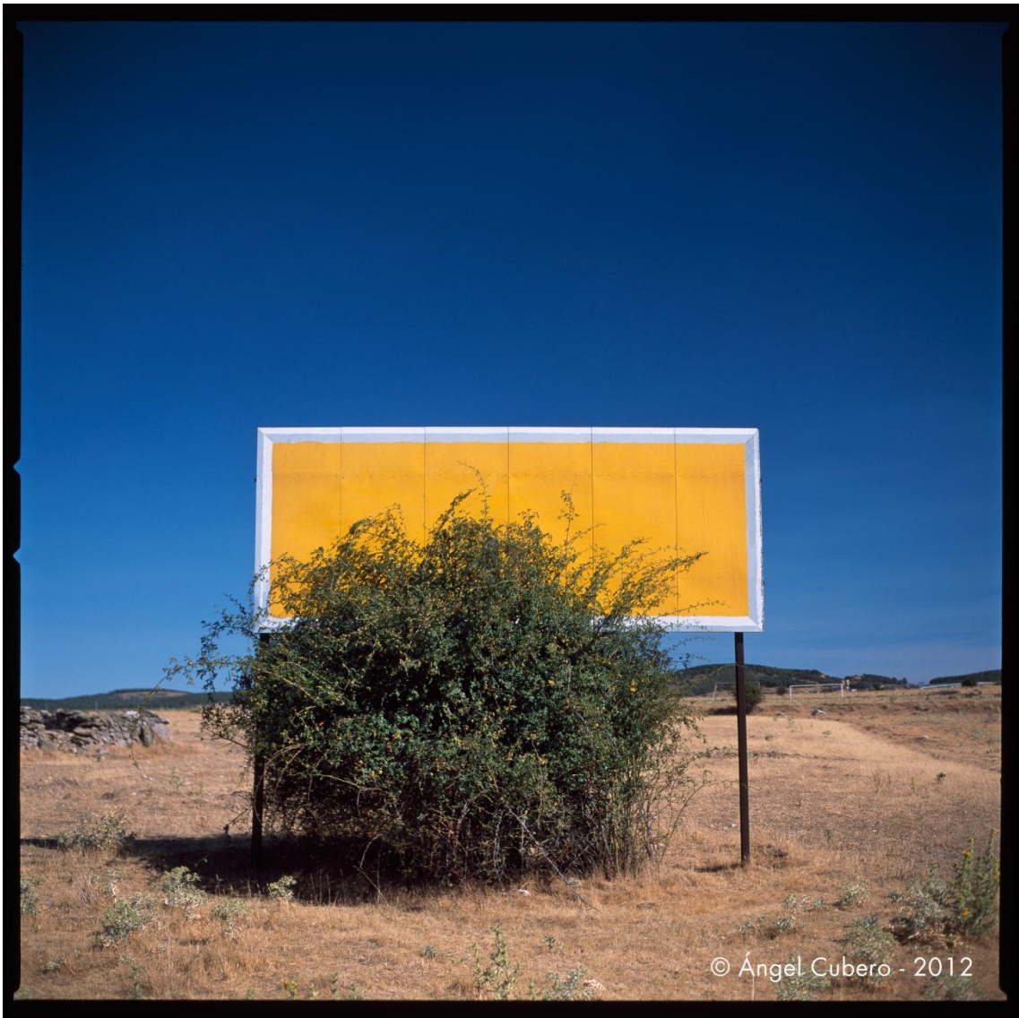
Burgos. Año 2003