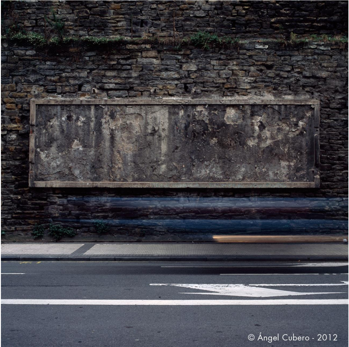
San Sebastián. Año 2007