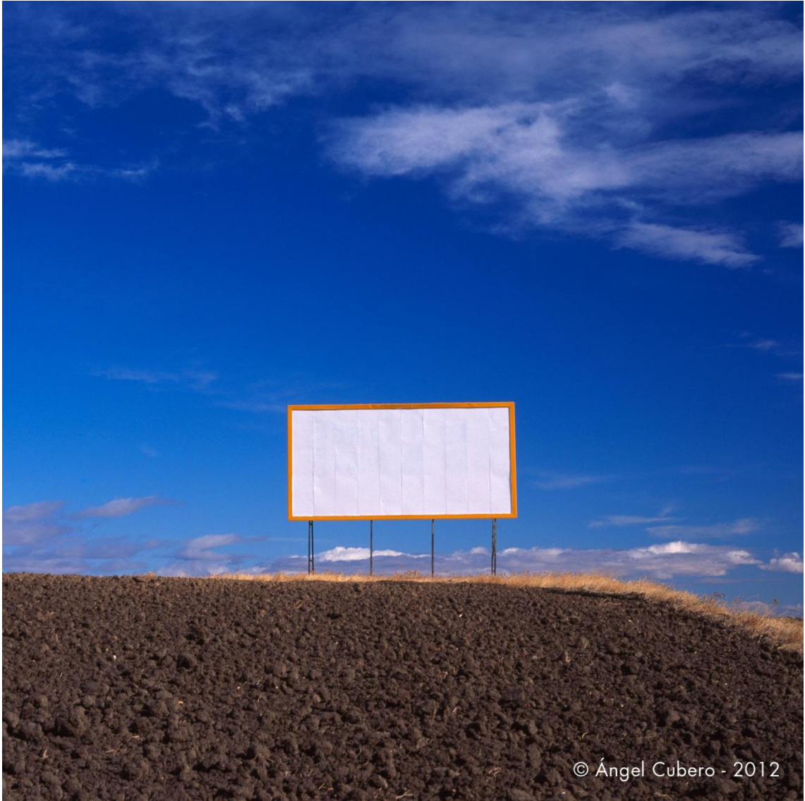
Carretera Madrid-Toledo. Año 2000.