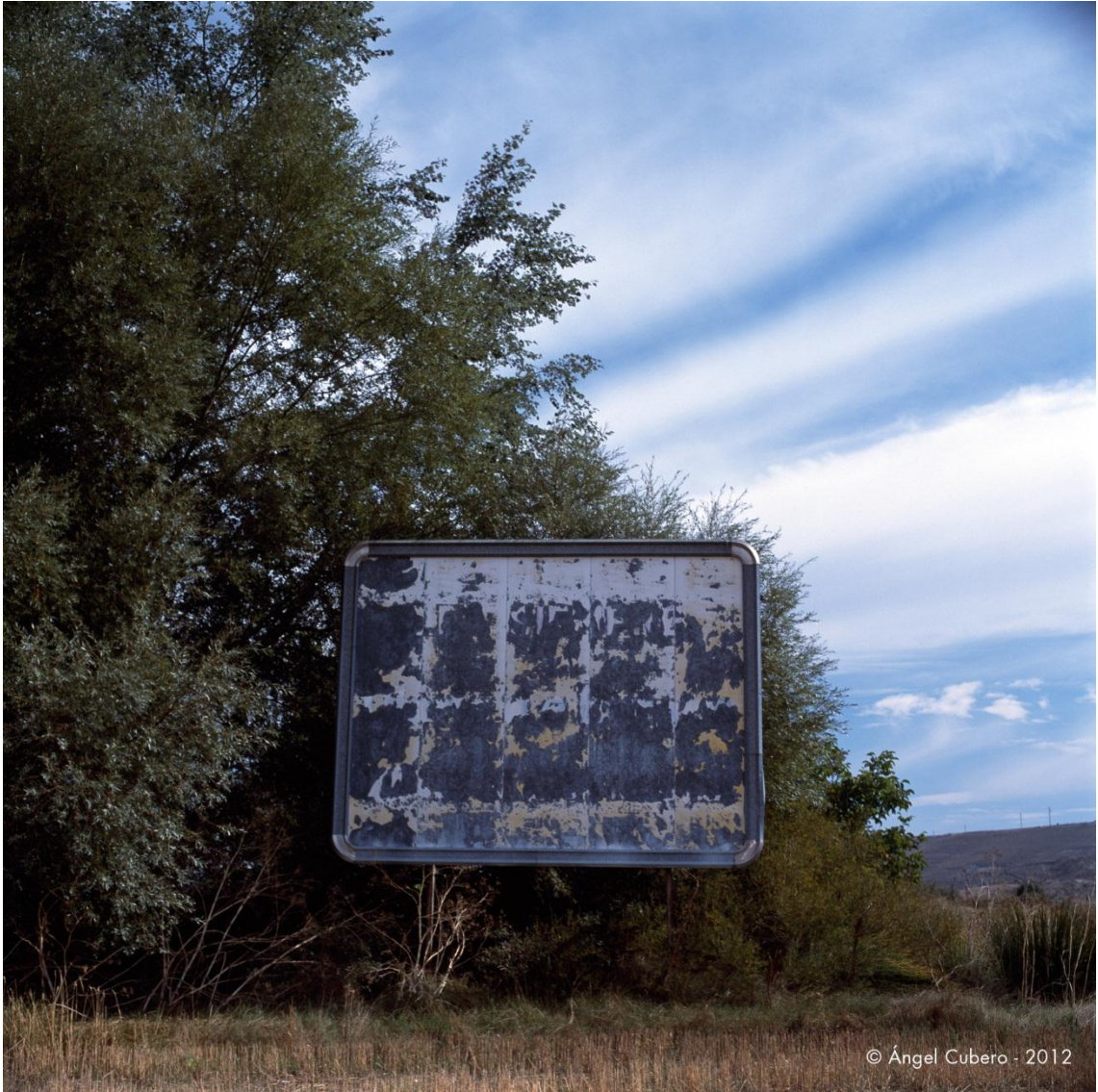
Burgos. Año 2003