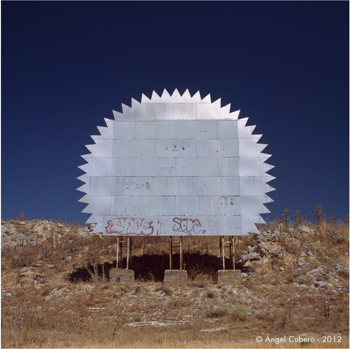
Cuenca. Año 2008