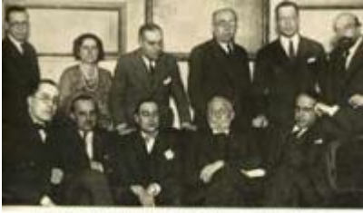
1930-40-47: Mundo Gráfico. Junta de Gobierno presidida por Marañón

28 de junio.- Con motivo de la conmemoración del cincuentenario de la muerte del doctor Marañón y en reconocimiento a su relevancia histórica, el Ateneo de Madrid, la Fundación Ortega-Marañón y la Fundación Tejerina han acordado la creación de la cátedra Marañón, con sede en el Ateneo.