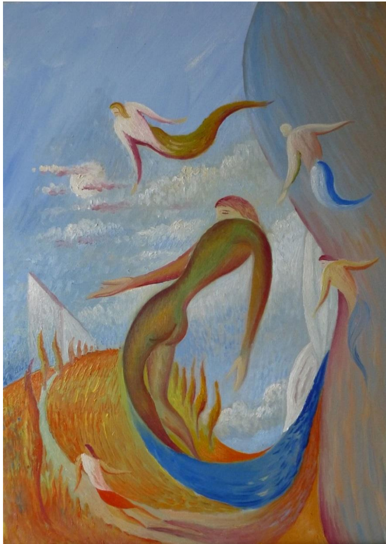
La sonrisa del paisaje , 2016 - óleo s/lienzo 46 x 33 cm