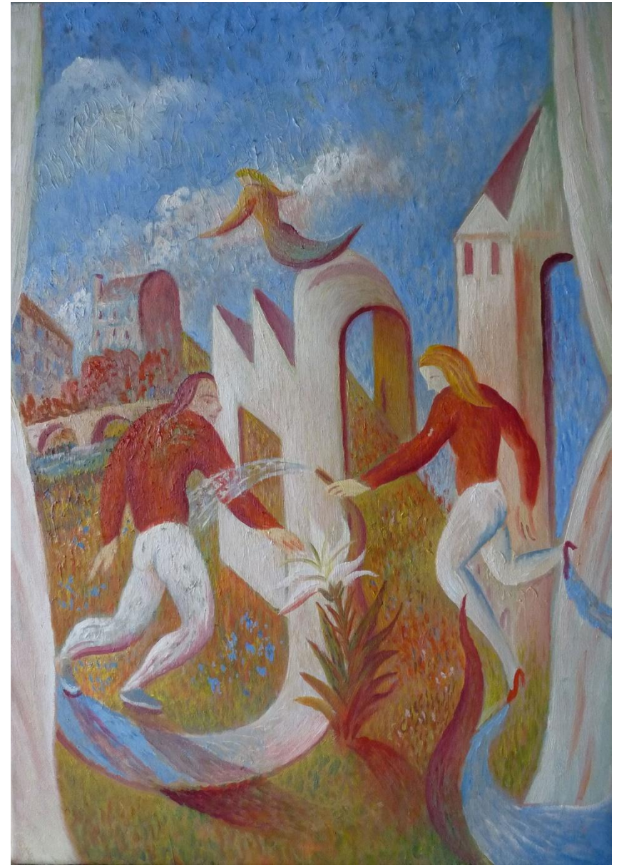
El agua de tu jardín, 2016 - óleo s/lienzo 65 x 46 cm