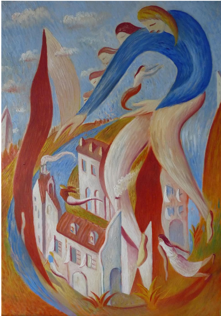
Volando pensamientos, 2016 - óleo s/lienzo 65 x 46 cm