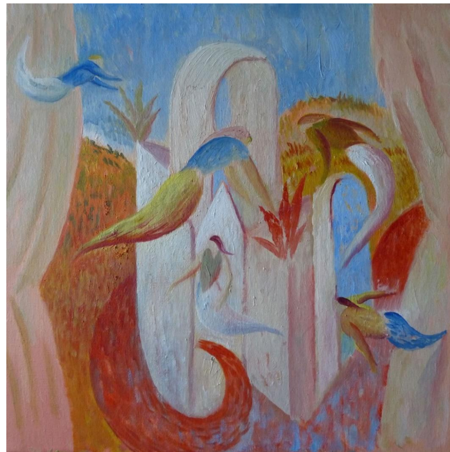
Remontando el vuelo, 2016 - óleo s/lienzo 40 x 40 cm