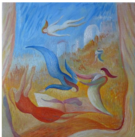
Sobrevolando un poema , 2016 óleo s/lienzo 33,5 x 33,5 cm