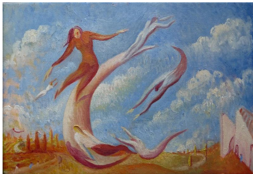
Celebración, 2016 - óleo s/lienzo 24 x 35 cm

Textos: Phillip Ward Traducción: Maya García de Vinuesa Coordinación: Blanca González López