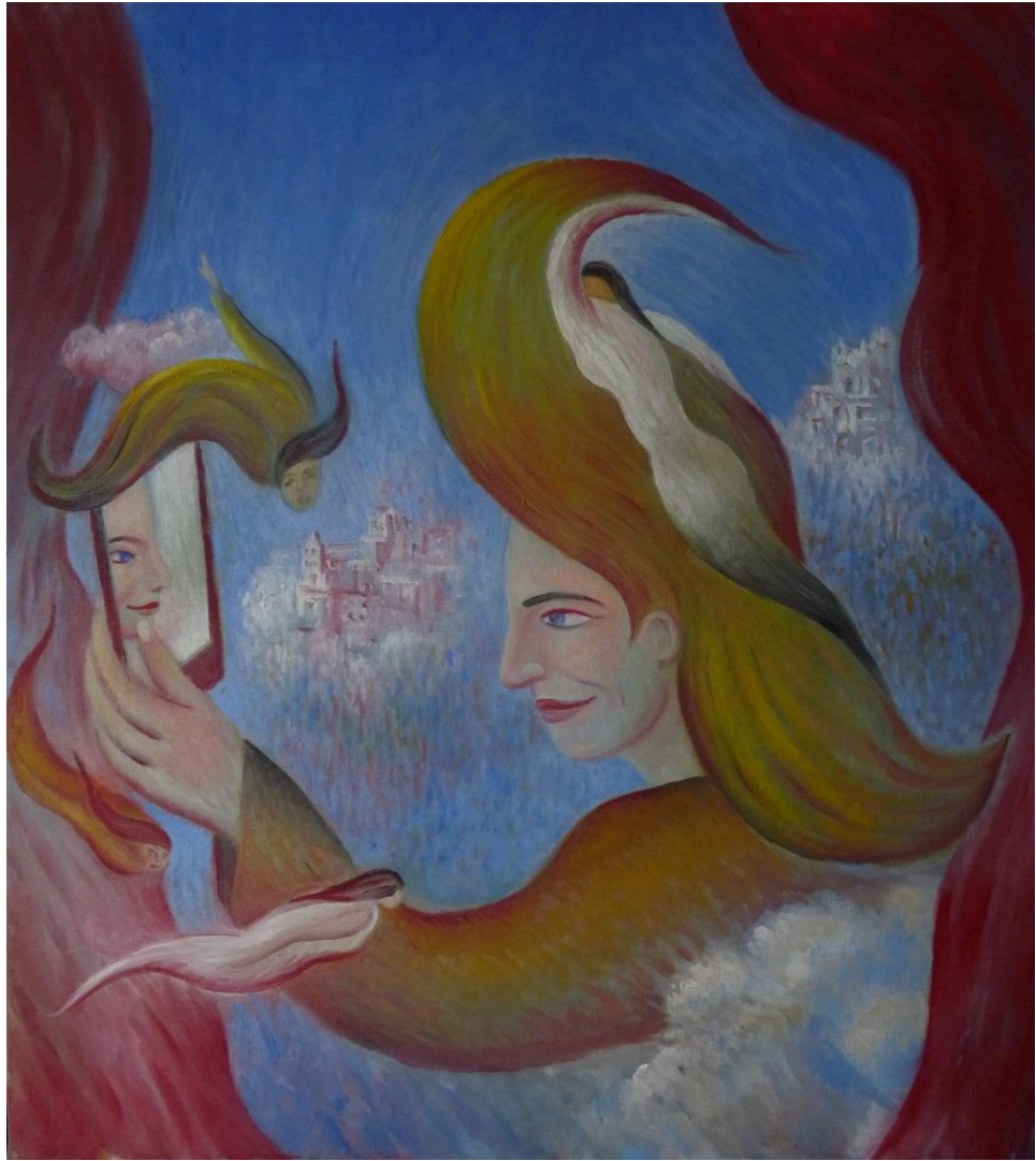
Selfi , 2015 - óleo s/lienzo 64,5 x 53 cm