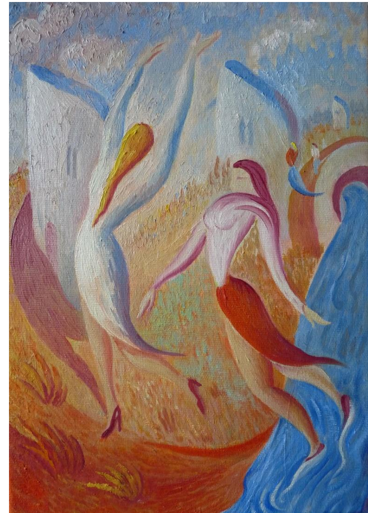
Las casas del río , 2016 - óleo s/lienzo 35 x 24 cm