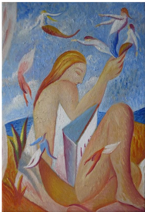
Libro de viajes, 2016 - óleo s/lienzo 35 x 24 cm