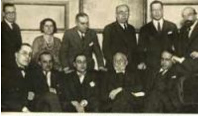
1930-40-47: Junta de Gobierno presidida por Marañón

28 de junio.- Con motivo de la conmemoración del cincuentenario de la muerte del doctor Marañón y en reconocimiento a su relevancia histórica, el Ateneo de Madrid, la Fundación Ortega-Marañón y la Fundación Tejerina han acordado la creación de la cátedra Marañón, con sede en el Ateneo.