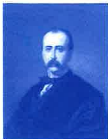
SEGISMUNDO MORET Y PRENDERGAST