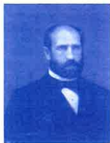
NICOLÁS SALMERÓN Y ALONSO

Pluralismo, transparencia y regeneración