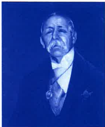
JOSÉ RODRÍGUEZ CARRACIDO

con puntualidad y constancia a las 45 conferencias, que durante el pasado curso se dieron los domingos y demás días festivos por la tarde. El silencio y la exquisita corrección, digna del mayor estímulo con que dichas conferencias fueron escuchadas, es una nota que no puede pasar inadvertidos por cuanto es testimonio evidente de que nuestras clases humildes, ávidas de salir de la ignorancia en que han vivido, son muy dignas del esfuerzo desinteresado que hace el Ateneo”.