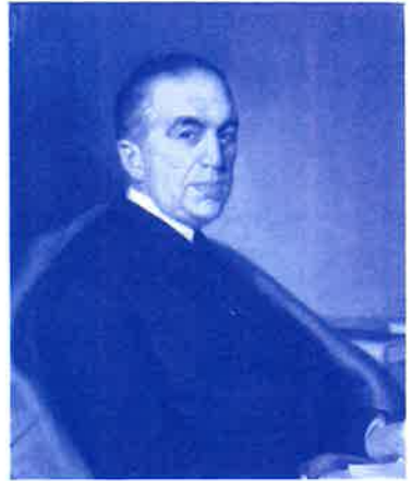
GREGORIO MARAÑÓN Y POSADILLO