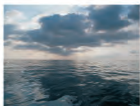
Todo lo que comienza con la decisión de intentarlo