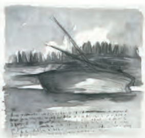
En cada uno de nosotros hay latiendo una obra maestra