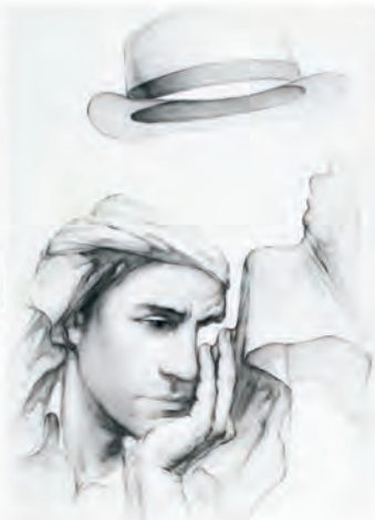
Nunca es demasiado tarde para ser la persona que podrías haber sido