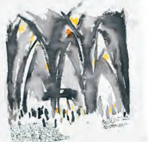
La vida es un eco. Lo que envías vuelve