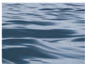
Cuando te impulsan tus sueños, ellos por encima de las circunstancias