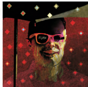
La diferencia entre un buen día y un mal día está en tu actitud