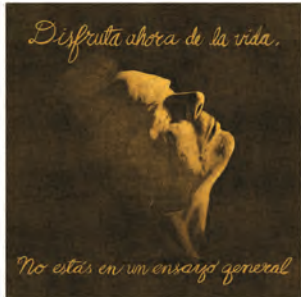
Disfruta ahora de la vida, no estás en un ensayo general