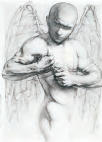
La pasión por conseguir tus sueños hace la vida interesante