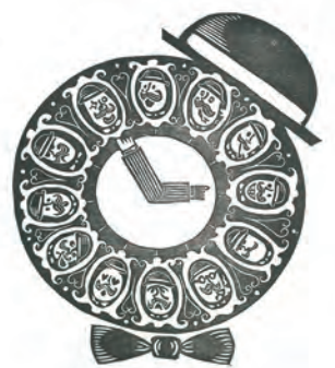
Cada instante puede ser una oportunidad de ser tu mismo