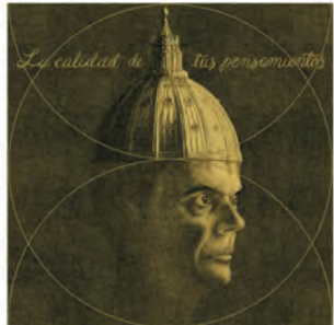
La calidad de tus pensamientos determina tus resultados