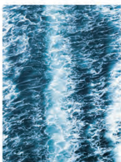
La felicidad no está en el destino, sino en el camino