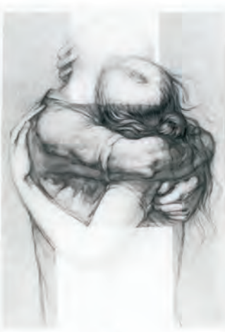
Hoy es un día perfecto porque estamos dentro