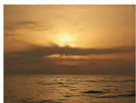
Hoy que hoy es un día escandalosamente increíble