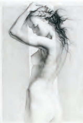
Un simple rayo de luz pulveriza la mayor oscuridad