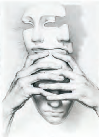
El miedo sólo espanta en tu mente