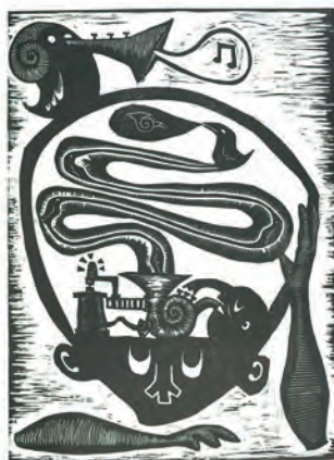
Todo lo real fue un día imaginario