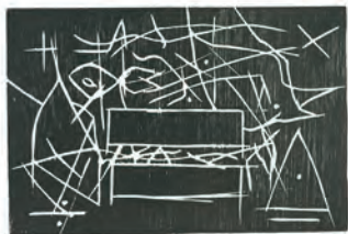
No espere fracasar, sólo espere resultados