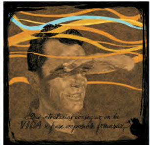
¿Qué intentarías conseguir en la vida a fuer imposible fracasar?