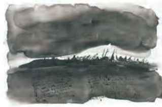
En la dificultad se logra disipar la oportunidad