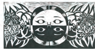
Tu mundo exterior es un reflejo de tu mundo interior