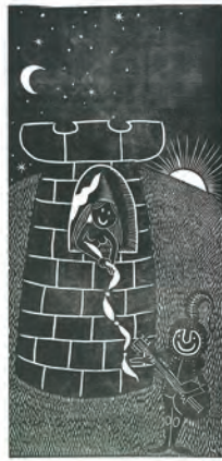
Una entrega total siempre es una victoria absoluta