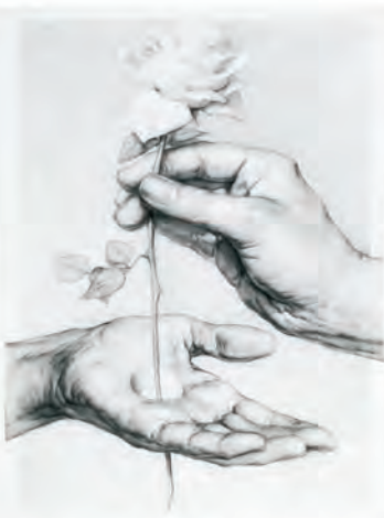
Cegad las rosas mientras podáis