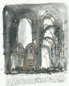
Perseverar es poner al universo a conspirar a tu favor