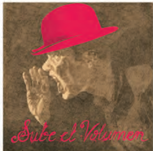
Si no puedes oír tu propia música, sube el volumen