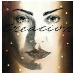
Si se encuentra tu trabajo ideal, créalo