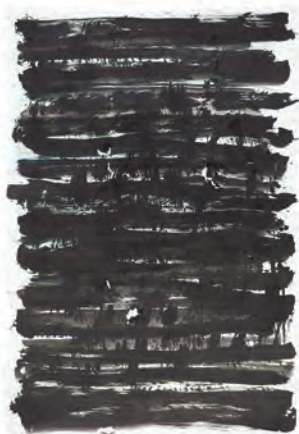
Lo esencial de este mundo es invisible para el ojo humano